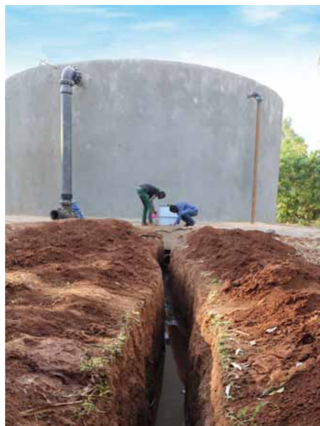
PHOTO CI-CONTRE : LE RÉSERVOIR DE 300 000 LITRES PRÊT À ÊTRE RACCORDÉ AUX SOURCES ET AU FORAGE

Le projet a pour vocation d'aider les communautés à gérer leurs ressources en eau de manière holistique et durable en leur donnant accès à l'eau, aux installations sanitaires et à l'hygiène (WASH) tout en développant ces ressources et en assurant la conservation des zones humides. Une avancée qui améliorera leur santé, leurs chances de survie et leur éducation, formant ainsi le socle d'un développement futur. WaterAid formera des agriculteurs aux techniques de gestion des ressources en eau et contribuera au rétablissement de l'équilibre écologique de la région en s'appuyant sur la démarche dite de gestion des ressources en eau basée sur la communauté (CBWRM), permettant de gérer plus efficacement leur eau grâce à des interventions écologiques mais également en se préparant aux sécheresses ♦