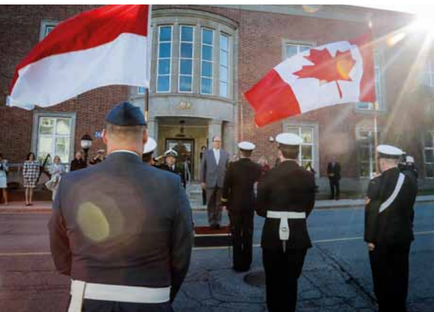
PHOTO CI-DESSUS : VISITE DE S.A.S. LE PRINCE SOVERAIN AU CANADA EN MAI 2018