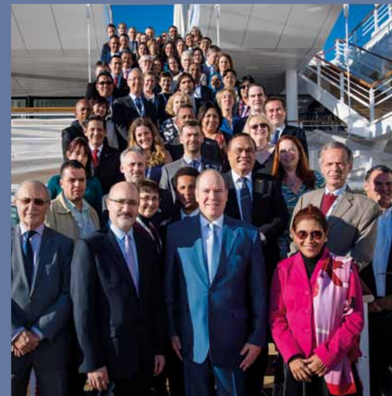
PHOTO CI-DESSUS : LES MEMBRES DE L'ICRI RÉUNIS LORS DE L'ASSEMBLÉE GÉNÉRALE