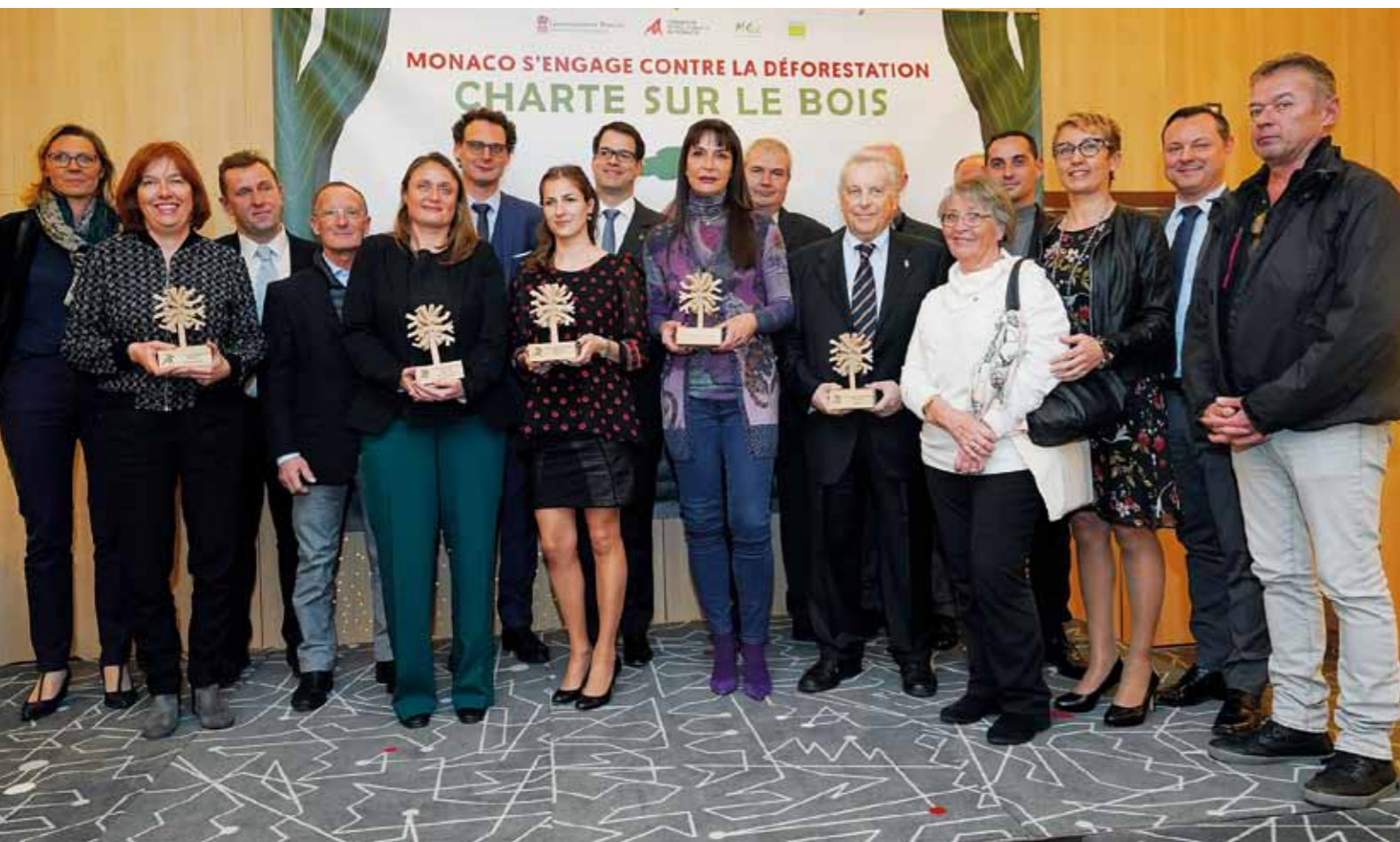
PHOTO CI-DESSUS : LES SIGNATAIRES PRIMÉS EN 2018 POUR L'EFFICACITÉ DE LEURS ACTIONS EN FAVEUR D'UN BOIS DURABLE.

La Fondation Prince Albert II de Monaco aux côtés de ses partenaires, la Direction de l'Environnement, l'Association MC2D et l'IMEDD, a réuni en décembre les entreprises signataires de la Charte sur le bois, créée en 2010 afin de sensibiliser les différents acteurs de la Principauté quant à une utilisation durable de cette ressource. Comptant aujourd'hui quelques 58 signataires, la Charte sur le bois est un texte fondateur en faveur d'un comportement exemplaire des entreprises monégasques en matière d'usage de bois certifiés et produits dérivés. Un enjeu environnemental important alors que la déforestation continue de détruire les forêts de notre planète à un rythme effrayant : chaque seconde, le monde perd une surface de forêt équivalente à celle d'un terrain de football et chaque année un territoire équivalent à celui de l'Italie.