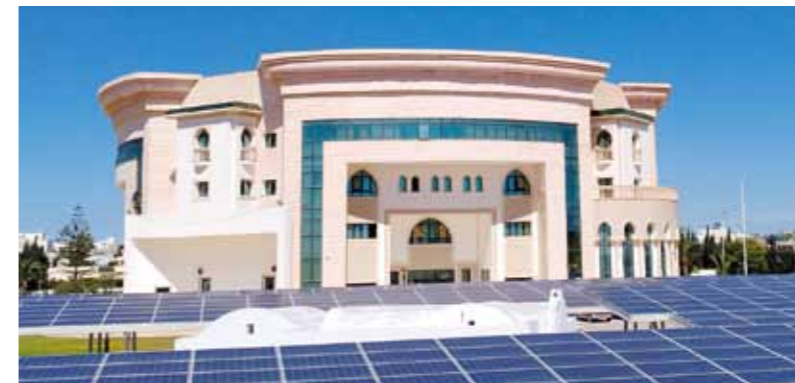
PHOTO CI-DESSOUS : INSTALLATION DE PANNEAUX SOLAIRES DEVANT LA MAIRIE DE NABEUL

“ ...La capacité de production totale d'énergie par an dépasse les estimations initiales...”