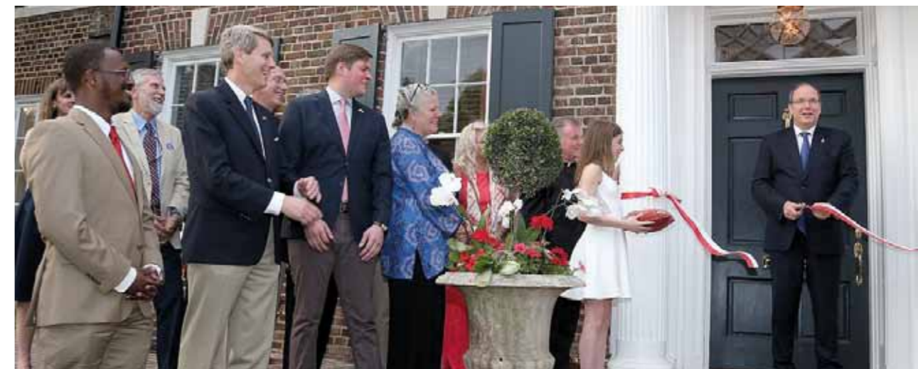
PHOTO CI-CONTRE : LE PRINCE SOUVERAIN INAUGURANT LA MAISON KELLY À PHILADELPHIE