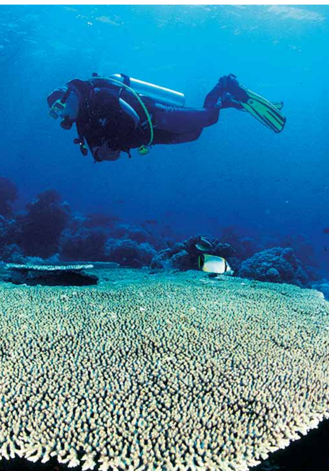
PHOTO CI-CONTRE : ATOLL DE RANGIROA EN POLYNÉSIE FRANÇAISE