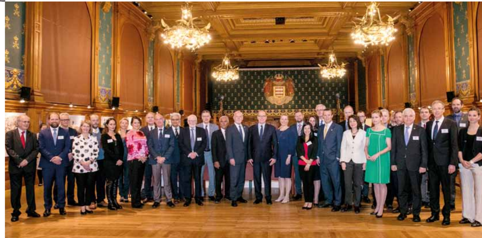
PHOTO CI-DESSOUS : RÉUNION DES FRIENDS OF THE OCEAN EN PRÉSENCE DU PRINCE SOUVERAIN ET DE MR PETER THOMSON, ENVOYÉ SPÉCIAL DES NATIONS UNIES.

“ En deux éditions de nombreuses initiatives ont pu être concrétisées et des engagements importants scellés...”