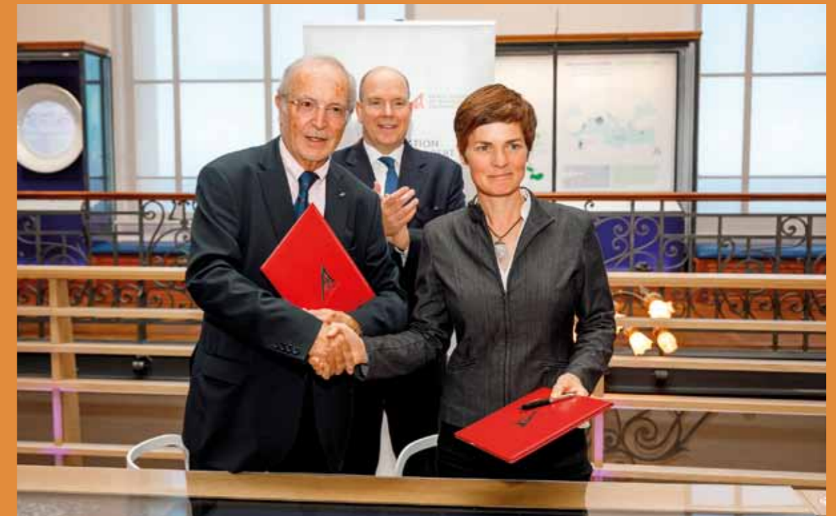
PHOTO CI DESSUS : SIGNATURE DU PARTENARIAT AVEC LA FONDATION ELLEN MACARTHUR