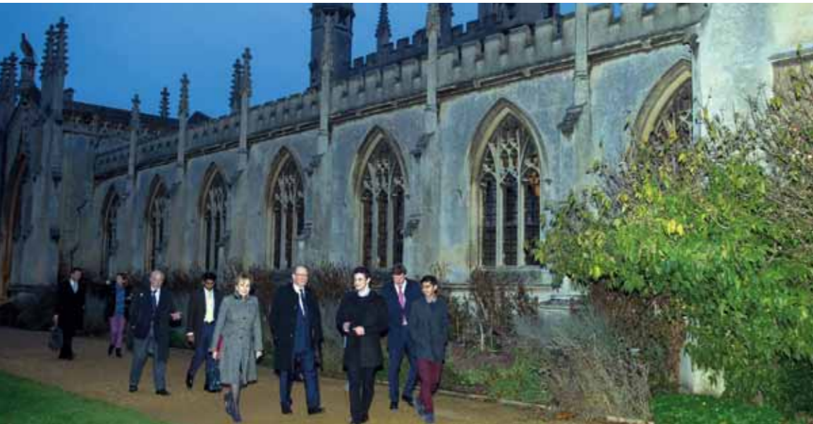
PHOTO DE GAUCHE : VISITE DE S.A.S. LE PRINCE ALBERT II DE MONACO À L'UNIVERSITÉ DE CAMBRIDGE

Maintenir le lien avec la recherche scientifique universitaire