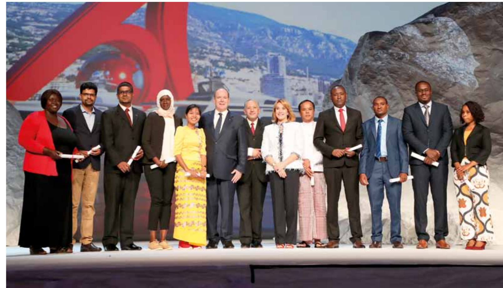
PHOTO CI-DESSOUS : LES LAURÉATS 2018 AUX CÔTÉS DU PRINCE SOUVERAIN © JC VINAI

La jeune génération sur le devant de la scène. Autre temps fort de la soirée, la remise des diplômes aux jeunes chercheurs dans le cadre du programme « Prince Albert II of Monaco Foundation grant for IPCC » honorant des étudiants pour la qualité de leurs travaux dans le domaine du changement climatique. Sélectionnés dans le cadre d'un accord passé