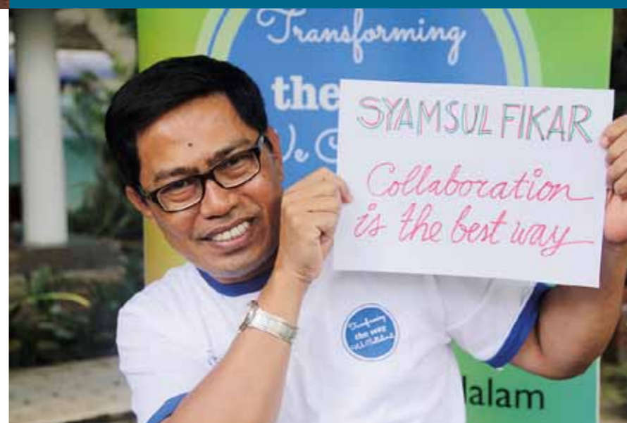
PHOTO CI-DESSOUS : GRÂCE AU CENTRE SOCIAL D'EXCELLENCE DES EXPERTS SONT FORMÉS AUX QUESTIONS SOCIALES

sur la biodiversité et sa contribution au changement climatique, affecte également les plus de 25 000 villages situés dans les forêts indonésiennes ou à proximité. Malheureusement, face au manque d'experts possédant les compétences nécessaires des conflits fonciers se multiplient dont une majorité est liée au développement du secteur privé. La création d'un climat de coopération est toutefois essentielle à la mise en œuvre d'une gestion durable des forêts. En 2008, confronté à des problèmes analogues dans le bassin du Congo, The Forest Trust avec le soutien de la Fondation avait créé le Centre d'excellence sociale (CSE) formant de futurs experts sur les questions sociales par le biais de cursus courts (une semaine ou un mois) et longs (10 mois), conjuguant ainsi un enseignement spécialisé, des travaux pratiques et des stages encadrés. Ce modèle de CSE sera répliqué en Indonésie, afin de bâtir un réseau d'experts afin de faciliter la résolution des conflits latents et forger des partenariats entre sociétés et communautés, dans le but de protéger les forêts encore intactes ♦